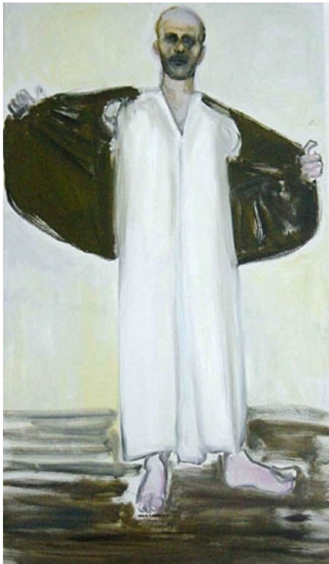
'The prophet' een schilderij van Marlene Dumas (Kaapstad, 1953) uit 2004.