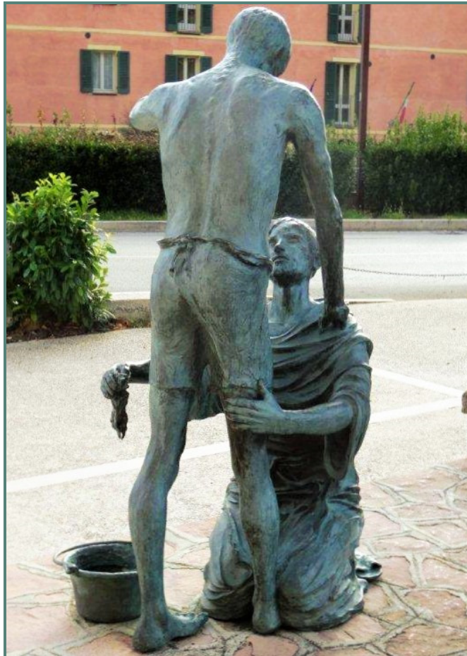
Beeld van Franciscus die een melaatse wast (bij de kerk in Rivotorto, ongeveer 4 kilometer van Assisi)

Het evangelie vertelt ons over een ontmoeting van een tiental mensen met Jezus. Een verhaal over afstand houden, isolement, maar ook gezien worden. En over dankbaarheid die niet vanzelfsprekend is. De Maaltijd deze zondag als omspeling van het evangelie.